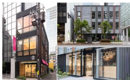
コスモスモア設計・施工事例 左：日本橋ムロホンビル3 / 右上&右下：Clipニホンパン

当社がコーディネートし、グループ会社のコスモスモアが設計・施工を担当します。費用を抑えたデザインから、スタイリッシュなデザインまで、その土地の価値を最大化するデザインを提案します。