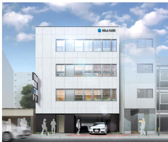
「(仮称)横濱関内プロジェクト」完成予想図

全国の500㎡未満のコインパーキングは、2005年時点で約25,000箇所でしたが、2015年には約60,000箇所と10年で2倍以上に増えており、2014年11月の「空き家対策特別措置法」の成立以降は、老朽化した建物の解体が進み、20～100㎡の空地が増加傾向にあります*。これらの駐車場を活用し、商業店舗などの新たに人々が集まる空間を作ることで、地域社会のさまざまなニーズに応える場の提供を行います。また、大和ハウスグループが連携することにより、大和ハウスパーキングがお取引するオーナーさまへのさらなる土地活用でも『SOLA CUBE』のご提案が可能となります。