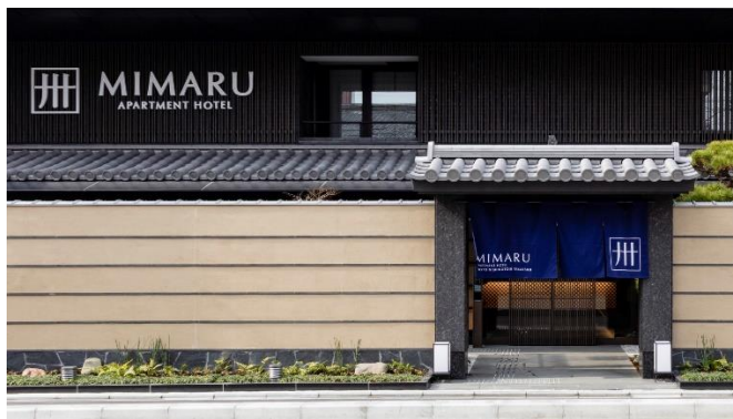
▲「MIMARU 京都 西洞院高辻」外観

※対応言語：英語、中国語、韓国語、ポルトガル語、スペイン語、ベトナム語、フィリピン語、タイ語、フランス語、ネパール語、ヒンディー語、ロシア語、インドネシア語