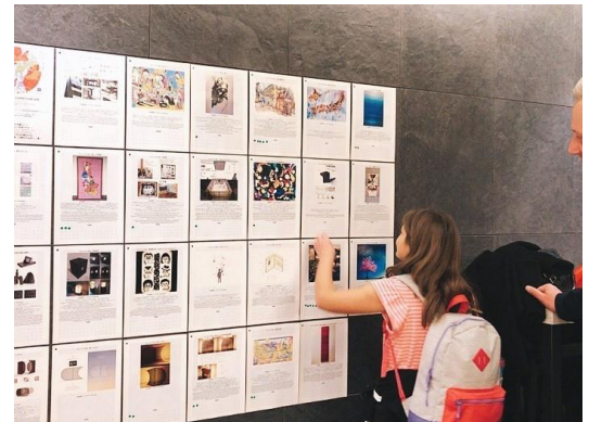
ゲスト投票の様子

「APARTMENT HOTEL MIMARU」( https://mimaruhotels.com/ )は、キッチンやリビング・ダイニングスペースを備え、ファミリーやグループでの中長期滞在ニーズに対応する都市型アパートメントホテルです。