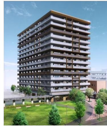
『イニシアグラン札幌イースト』 モデルルーム（左）・外観完成予想CG（右）