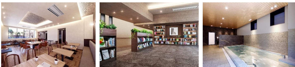
『イニシアグラン札幌イースト』 カフェダイニング (左) ・ ホワイエ (中) ・ 大浴場 (右)