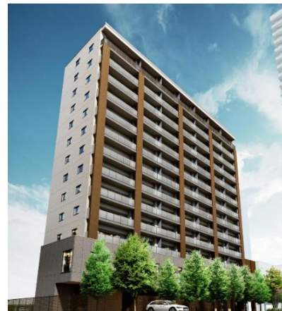
『イニシアグラン札幌苗穂』 モデルルーム（左）・外観完成予想CG（右）