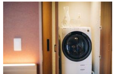
客室内に洗濯機を設置