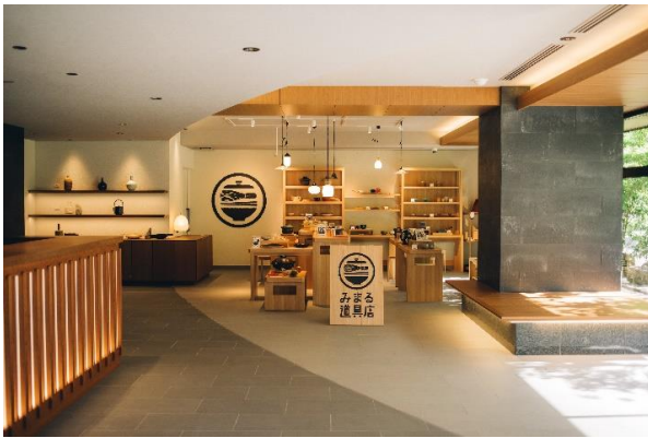
1階ロビー「みまる道具店」

大和ハウスグループの株式会社コスモスイニシアおよび株式会社コスモホテルマネジメントは、2ベッドルーム以上のスイートタイプの客室を全室に採用した新しいスタイルのアpartメントホテル『MIMARU SUITES 京都四条』を2021年7月22日（木）にオープンしますのでお知らせします。『MIMARU SUITES 京都四条』では、創業百余年の日本の手仕事のセレクトショップ「川端滝三郎商店」や、食器や民芸、荒物などの生活道具を取り扱う「倉日用商店」など、京都の目利きが集めた暮らしの道具を揃え、好きな道具をお部屋内で自由に使える、ホテルと道具店が融合した新サービスを提供します。