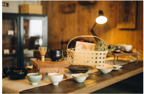
「プレミアムルーム」客室内道具

アpartメントホテル ミマル（MIMARU）の新シリーズとして誕生する「MIMARU SUITES」は、高級シティホテルに数室ずつしかなかった2ベッドルーム以上の客室を全室に採用した新しいスタイルの都市型アpartメントホテルです。リビング・ダイニングとベッドルームを分け、プライベート空間を確保した広い客室を、ご利用いただきやすい料金でご用意しています。