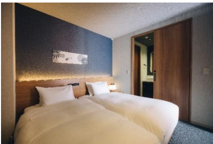
主寝室（プライベートバス付き）