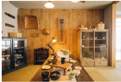
「プレミアムルーム」