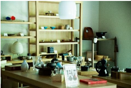
1階ロビー「みまる道具店」

1階ロビーには、創業百余年の日本の手仕事のセレクトショップ「川端滝三郎商店」や、食器や民芸、荒物などの生活道具を取り扱う「倉日用商店」など京都の目利きが集めた、日本で長く愛用されてきた日用品を揃えています。宿泊者は、実物を手に取り、お気に入りの器や調理道具などを客室内で無料でお試しいただけます。また、器による味の違いを楽しむお茶・酒器セットや、珈琲・鍋・お寿司などの調理道具セットもご用意しています。