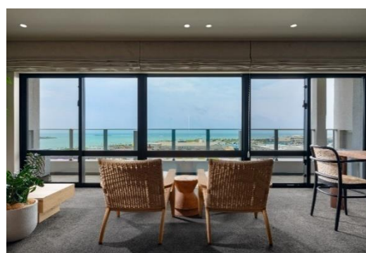
『グランコスモ ザ・リゾート沖縄豊崎』建物外観（左）／ 美らビューラウンジ（右）

『グランコスモ ザ・リゾート沖縄豊崎』は、那覇空港や離島へ渡る海の玄関口の泊港から車で約15分という立地にありながら、美しいサンセットを望むビュースポットとしても人気の「美らSUNビーチ」や大型商業施設も充実する、豊かな自然と都市機能の生活利便を享受できる希少性の高いリゾートエリア「豊崎タウン」に誕生しました。