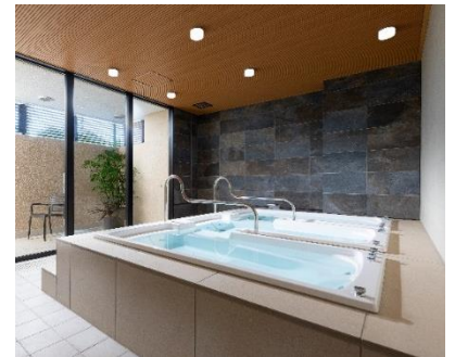
『グランコスモ ザ・リゾート沖縄豊崎』 ゲストルーム (左) / フィットネスルーム (中) / ジャグジー (右)