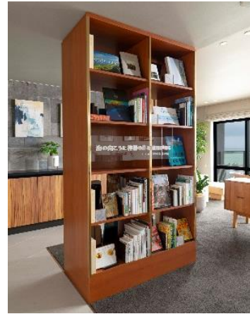
『グランコスモ ザ・リゾート沖縄豊崎』 美らビューラウンジ (左) / 「BACH」 監修ライブラリーコーナー (右)