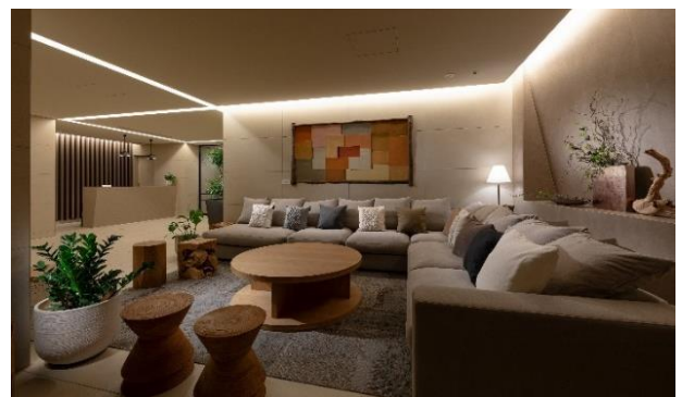
『グランコスモ ザ・リゾート沖縄豊崎』 エントランスラウンジ