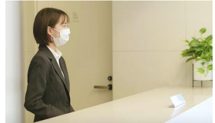
『グランコスモ ザ・リゾート沖縄豊崎』コンシェルジュ

日常生活全般に関わるご要望にお応えするだけでなく、入居者同士のコミュニケーションや地域とつながる情報提供やイベント企画などを通し、さまざまな過ごし方にお応えするサービスをご提供してまいります。