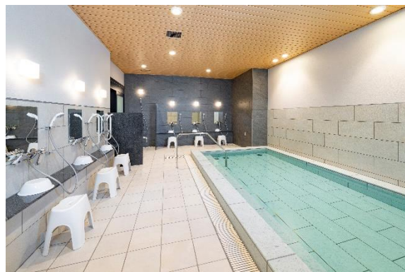
『イニシアグラン札幌イースト』 カフェダイニング／大浴場