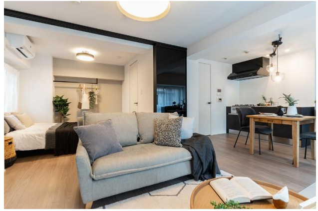
「バルコニストの家（メロディーハイム中津5番館）」①リビング・ダイニング（左）／ ②リビング・ダイニング・キッチン（右・クアドロスリム開放時）