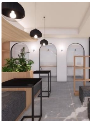
個室ブース完成予想 CG

専用駐輪ポートであれば、どこでも自由に貸出・返却ができるシェアモビリティサービス「PiPPA(ピッパ)」を京都の分譲マンションで初めて敷地内に導入しており、街が平坦かつ多様なスポットがコンパクトに集まる京都において、移動手段として人気の自転車もシェアすることが可能です。利便性の高い立地に自転車という選択肢が増えることで、通勤・通学や休日の過ごし方の幅がより広がります。