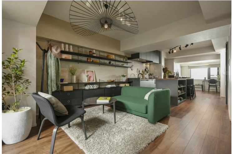
Aタイプモデルルーム リビング・ダイニング・キッチン