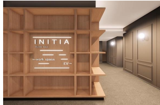
エントランス完成予想 CG