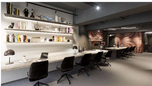
共用ラウンジ 完成イメージ

座席数は合計 22 席、TEL ブースを 3 室、会議室（4 名）を 1 室、打ち合わせスペースを 1 席用意しており、多様な働き方に応えられるような設備を整えております。