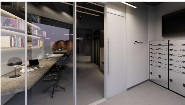
エントランス 完成イメージ

ROOM(個室)プランまたは BOOTH(半個室)プランを契約された方が利用できるエリアです。