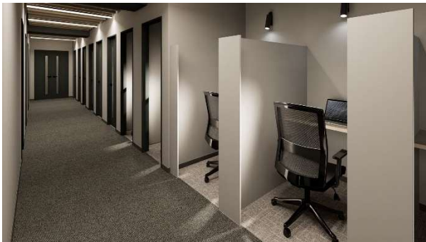
執務エリア 完成イメージ