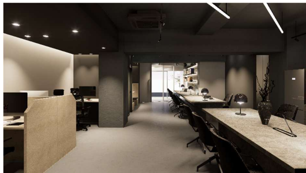
共用ラウンジ 完成イメージ