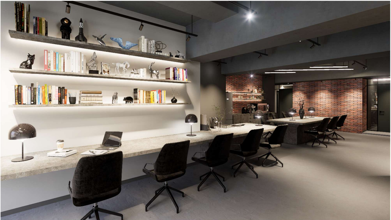
『MID POINT 市ヶ谷』ラウンジ完成予想イメージ

大和ハウスグループの株式会社コスモイニシアは、「職住近接」を実現するシェアオフィス『MID POINT 市ヶ谷』（東京都千代田区）を、都営新宿線「市ヶ谷」駅徒歩3分の立地に2024年7月に開業します。開業に先立ち、2024年5月27日から『MID POINT 市ヶ谷』の紹介ホームページにて、入居者募集およびWEB内覧を開始いたしました。