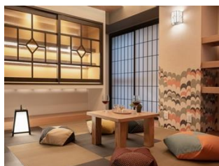
フレキシブルに使える畳スペース