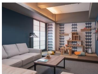
広々としたリビング

全室リビング、キッチン&ダイニングと畳スペースに加え、2~3ベッドルームで構成された、スイートタイプの客室。多人数で同室に泊まる楽しさと、それぞれがくつろぐ時間を大切にできます。