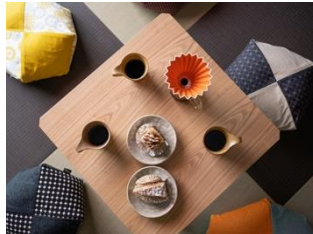
自由を楽しめる食事