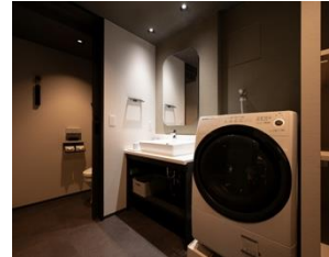
洗面・ランドリー