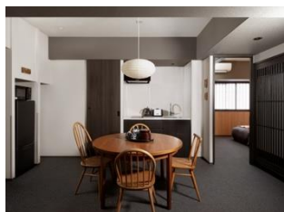
キッチン&ダイニング

キッチンには食器や調理器具が揃い、地元の食材を使って料理をしたり、テイクアウトや人気店のデリバリーを利用したりするなど、旅先の食事とも思いのままに。室内には2つのバスルームと洗濯機を備えており、ゆっくりお風呂につかったり、洗濯したり、自宅にいるような時間をおすごしいただけます。