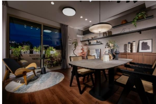
『イニシア芦屋レジデンス』 モデルルーム

大和ハウスグループの株式会社コスモイニシアは、新築分譲マンション『イニシア芦屋レジデンス』（兵庫県芦屋市、総戸数27戸）の第1期2次登録申込受付を2023年7月14日から開始いたしましたのでお知らせします。