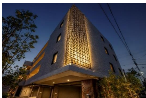
外観／瓦スクリーン