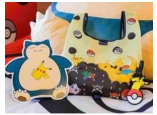
ポケモンルームオリジナルノベルティ（関西デザイン）

キッチンには食器や調理器具が揃っているので、京都の食材を使って料理をしたり、人気店のお惣菜をテイクアウトしたりするなど、外食が続きがちになるホテル滞在でも、思いのままに食事を楽しめます。また、旅の疲れを癒すバスタブ付きのバスルームやランドリールームも完備しています。