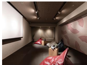
エンターテインメントルーム