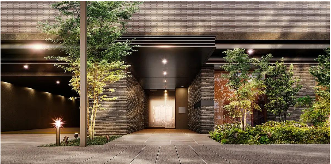
『イニシア吹田』 エントランス完成予想図

大和ハウスグループの株式会社コスモイニシアは、株式会社大栄不動産との共同事業で新築分譲マンション『イニシア吹田』（大阪府吹田市、総戸数 81 戸）の開発を進めています。4 月 12 日（金）から第 1 期 1 次の販売を開始し、JR 大阪駅まで直通 9 分・JR 吹田駅徒歩 6 分の利便性や、すごしかたにこだわった空間づくり等が評価され第 1 期全戸申込完売いたしました。このたび 6 月 7 日（金）から第 2 期 1 次の購入登録受付を開始しますのでお知らせします。