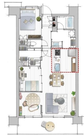
(左) 廊下付けキッチンイメージ図 / (右) 廊下付けキッチンタイプ