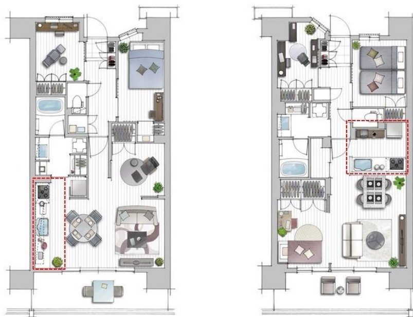
(左) 壁付けキッチンタイプ / (右) カウンターキッチンタイプ

▶「カウンターキッチンタイプ」：キッチン前に立ち上がりを設けており、リビング・ダイニング側から手元の調理スペースを隠し、料理する姿も、キッチン自体も美しく映えるタイプ。コンロ前の壁をなくし、料理中や片付中もリビング・ダイニングの家族と会話を満喫できるのが特徴。