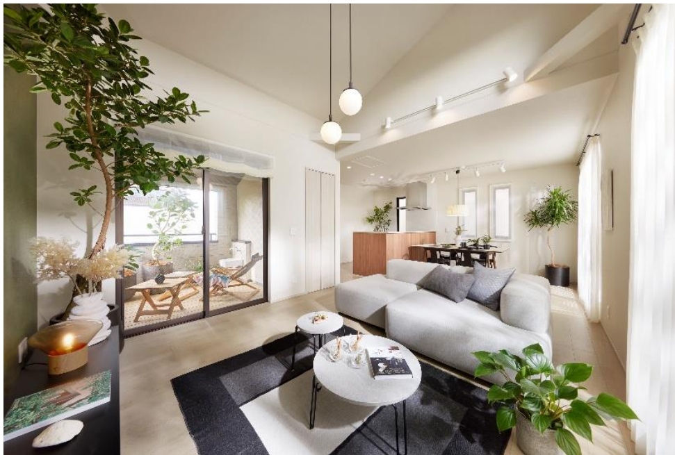
『イニシアフォーラム井の頭恩賜公園』 10号棟・ダイニング・キッチン・インナーバルコニー

大和ハウスグループの株式会社コスモイニシア（本社：東京都港区、社長：高智 亮大朗、HP： https://www.cigr.co.jp/ ）は、新築分譲一戸建『イニシアフォーラム井の頭恩賜公園』（東京都三鷹市、総区画数10区画）の第1期1次4区画（3・4・8・9号棟）について2024年9月21日から購入登録受付を開始しました。