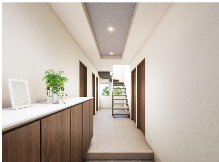
『イニシアフォーラム井の頭恩賜公園』 8号棟 玄関完成予想図

「井の頭恩賜公園」内を歩いて帰り着き、玄関を開けると奥の窓から緑が見える。上下階をつなぐ階段には、空間の広がり表現する鉄骨階段を採用（3・4・5号棟除く）。